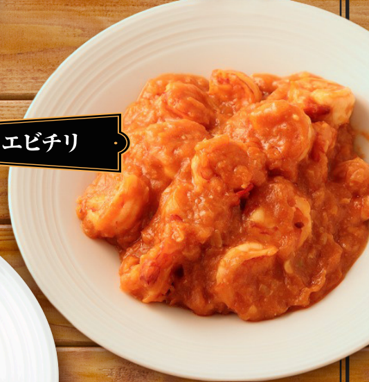
・ テイスティ・エビチリ ・

オススメしたいのは、ケチャップの風味を ダイレクトに味わえる「つけ・かけ」。フライド ポテトも、フルーツビネガーとオリジナル ブレンドのスパイスの風味で楽しめます!