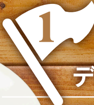
ディップ、つけ、かけ

オススメしたいのは、ケチャップの風味を ダイレクトに味わえる「つけ・かけ」。フライド ポテトも、フルーツビネガーとオリジナル ブレンドのスパイスの風味で楽しめます!