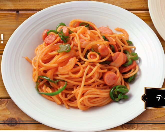
・ テイスティ・ナポリタン ・

いつものケチャップを「デルモンテ トマ トケチャップ デリカパック テイスティ」 に変えると、素材の味わいを活かしつ つ、しっかりとしたケチャップの存在感 も出て、メニューのボディ感がアップし ます。ナポリタンなどの洋食はもちろん、 エビチリなどの中華にもオススメです。