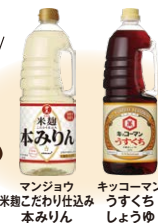
マンジョウ 米麹こだわり仕込み本みりん キッコーマン うすくちしょうゆ