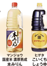
マンジョウ 国産米濃厚熟成本みりん ヒゲタ こいくちしょうゆ