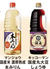
マンジョウ 国産米濃厚熟成本みりん キッコーマン 国産丸大豆しょうゆ