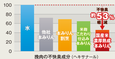
■挽肉の不快臭成分の比較 (ヘキサナル)

※肉の不快臭成分の一つであるヘキサナルの生成量 (調理加熱後) をガスクロマトグラフィーにより分析 ※有機酸の一つであるクエン酸が肉の不快臭成分の生成を抑制する働きがあります